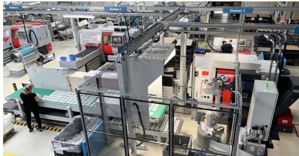
La cella di automazione di Praher consiste in un centro di tornitura e fresatura Emco Hyperturn 45, compresa l'estrazione dei trucioli e una cella robotizzata ABB Flexloader™ FP600 con stazione di sbavatura e unità di soffiaggio.

Il parco macchine, una gran parte del quale proviene dal produttore austriaco di macchine utensili Emco, è cresciuto nel corso degli anni ed è già in parte automatizzato: „Naturalmente, non da ultimo a causa della globalizzazione, siamo tenuti a svilupparci costantemente e quindi anche