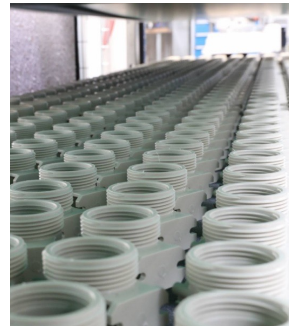
Lo scarico del nastro trasportatore è lungo 6.000 mm.

Il FlexLoader FP 600 è un sistema automatico in cui i pezzi vengono posizionati manualmente su un nastro trasportatore (5.000 x 800 mm). Il nastro viene riempito durante il funzionamento e la rimozione dei pezzi può quindi avvenire in qualsiasi momento senza interruzione. „Questo assicura un'autonomia di almeno quattro e fino a otto ore“, conferma