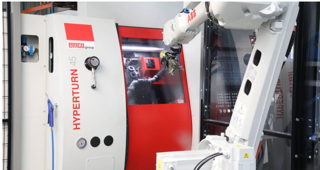
Un duo dinamico: alla Praher Plastics Austria S.r.l. un robot ABB assicura alti tempi di funzionamento del mandrino dell'Hyperturn 45 di Emco

✓ Benefici: Autonomia da quattro a otto ore; riduzione dei tempi complessivi di lavorazione; alta affidabilità del processo; alta qualità delle parti in plastica lavorate.