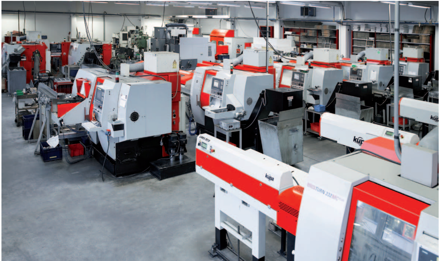
Maschinenpark von Fa. Brisker mit zahlreichen EMCOTURN 332, HYPERTURN 665 und HYPERTURN 45.