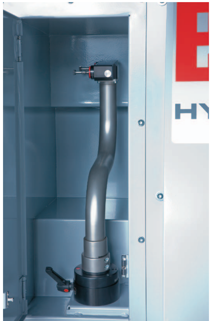
Ablage für den herausnehmbaren Werkzeugvermessungsarm