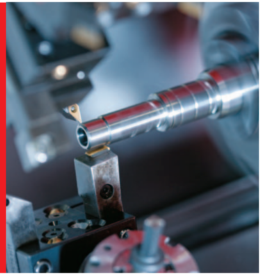
Simultane Drehbearbeitung mit beiden Revolvern an der Haupt- bzw. Gegenspindel möglich.

Teilespektrum: Die Brisker GmbH fertigt als Industrielieferer aller Branchen Dreh- und Frästeile in Serien von 50 bis 5.000 Stück aus allen gängigen Materialien.