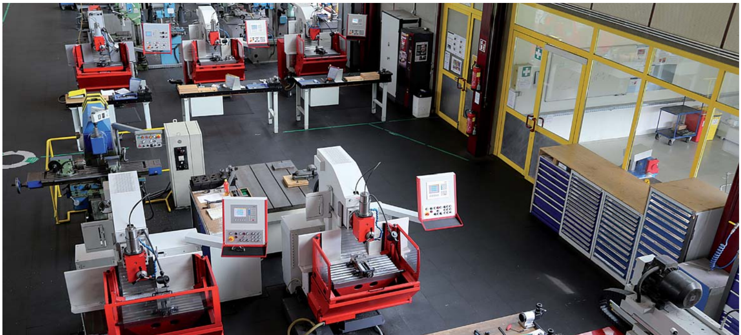
Auch für die konventionelle Bearbeitung setzt das Böhler Edelstahl Ausbildungszentrum auf Maschinen von Emco.

Eine maximale Ausbaustufe erlaubt ein Magazin von bis zu 50 Werkzeugplätzen. Auch eine Motorspindel mit 24.000 U/min ist optional statt der verwendeten 12.000er mechanischen Spindel möglich“, beschreibt Pichler die Ausstattung der Maschine. „Wir haben bewusst nicht die maximalen Optionen gewählt. Einerseits ist es für die Ausbildung gar nicht nötig, andererseits wollten wir einen guten Leistungsdurchschnitt abbilden, wie ihn die neuen Kollegen dann im Betrieb vorfinden“, erläutert Grätze. „Trotzdem haben wir ein paar hilfreiche Ergänzungen dazu genommen: Das Heidenhain 3D-Tastsystem für die Werkstück- und Werkzeugvermessung, elektronisches Handrad, programmierbare Druckluftzuführung und Spülpistole beispielsweise sind Ausstattungsmerkmale, wie sie den Lehrlingen später im Betrieb regelmäßig begegnen. Der Umgang damit muss einfach erlernt werden und sitzen“, so Hr. Grätze weiter.