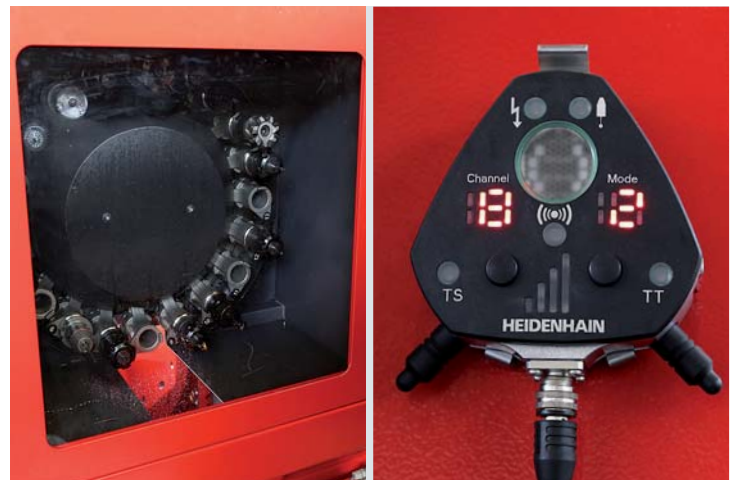
Das Werkzeugmagazin mit 20 Plätzen und die Heidenhain Tasteinrichtung für Werkstück- und Werkzeugvermessung ergänzen die Maschinenausstattung für einen betriebsnahen Ausbildungsbetrieb..

„Optional kann die Maschine aber auch problemlos mit hocheffizienten Torque-Antrieben auf 5-Achs-Simultanbearbeitung aufgerüstet werden. Im Werkzeugmagazin finden 20 Werkzeuge mit ISO 30-Aufnahme Platz, wobei die Werkzeugwechselzeit lediglich zwei Sekunden beträgt.“