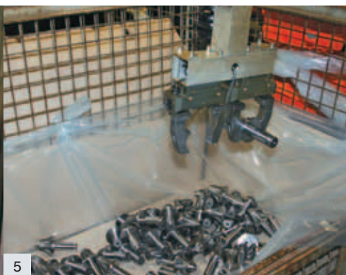
1-5 Automatisiert wurde die Bearbeitung der Schmiedeteile mit zwei ABB-Robotern, die ausgerüstet mit zwei SCHUNK 2-Backen-Greifer das Werkstück-Handling übernehmen.