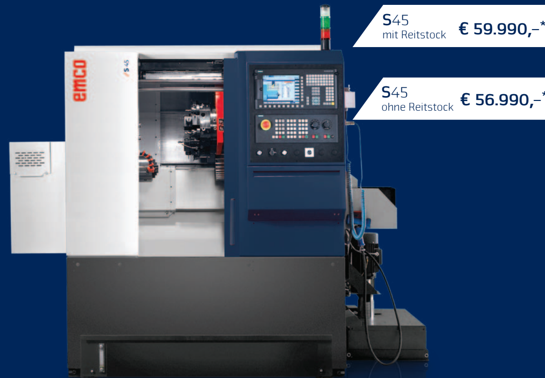
Maschine mit optionaler Ausstattung.

Kompakte CNC-Drehmaschine mit Dreh-/Fräs-Revolver zur Stangenbearbeitung bis \varnothing 45 mm und Futterteilbearbeitung bis 220 mm. Leistungsstarke Hauptspindel mit maximaler Drehzahl von 6300 U/min und 11 kW Antriebsleistung. Für die Wellenbearbeitung auch mit Reitstock lieferbar. Die Maschine besticht mit optimaler Zugänglichkeit und kann somit bestmöglich für die Kleinserienfertigung eingesetzt werden.