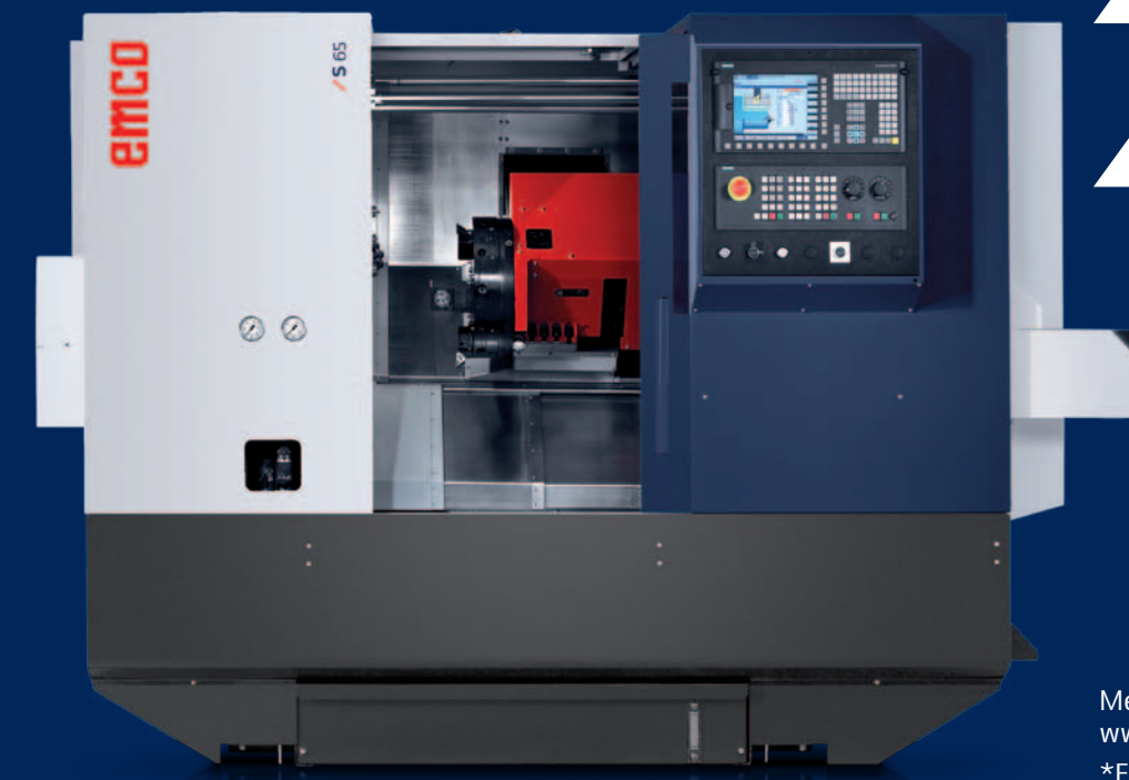
Maschine mit optionaler Ausstattung.

Leistungsstarke CNC-Drehmaschine mit Dreh-/Fräs-Revolver zur Stangenbearbeitung bis \varnothing 65 mm und Futterteilbearbeitung bis 310 mm. Leistungsstarke Hauptspindel mit maximaler Drehzahl von 4200 U/min und 18 kW Antriebsleistung. Für die Wellenbearbeitung auch mit automatischem Reitstock lieferbar. Die Maschine besticht mit optimaler Zugänglichkeit und kann somit bestmöglich für die Kleinserienfertigung eingesetzt werden.