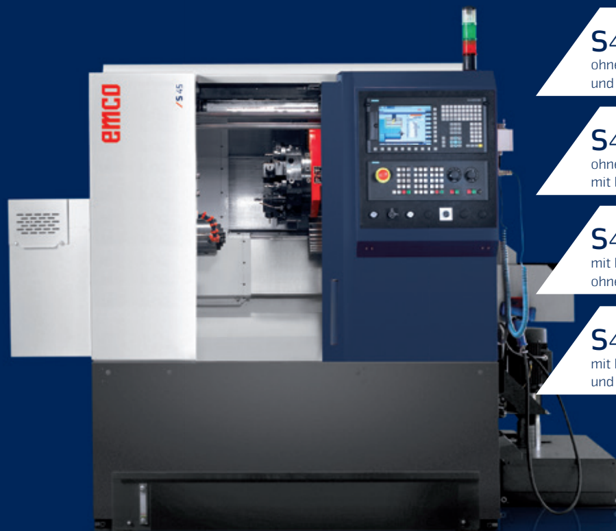
Maschine mit optionaler Ausstattung.

Kompakte CNC-Drehmaschine mit Dreh-/Fräs-Revolver zur Stangenbearbeitung bis \varnothing 45 mm und Futterteilbearbeitung bis 220 mm. Leistungsstarke Hauptspindel mit maximaler Drehzahl von 6300 U/min und 11 kW Antriebsleistung. Für die Wellenbearbeitung auch mit Reitstock lieferbar. Die Maschine besticht mit optimaler Zugänglichkeit und kann somit bestmöglich für die Kleinserienfertigung eingesetzt werden.