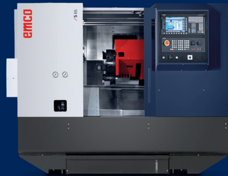
Maschine mit optionaler Ausstattung.

Leistungsstarke CNC-Drehmaschine mit Dreh-/Fräs-Revolver zur Stangenbearbeitung bis \varnothing 65 mm und Futterteilbearbeitung bis 310 mm. Leistungsstarke Hauptspindel mit maximaler Drehzahl von 4200 U/min und 18 kW Antriebsleistung. Für die Wellenbearbeitung auch mit automatischem Reitstock lieferbar. Die Maschine besticht mit optimaler Zugänglichkeit und kann somit bestmöglich für die Kleinserienfertigung eingesetzt werden.